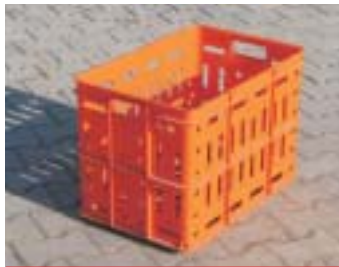
PR - Transportbehälter 357-515