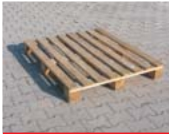
IP3-2 - Holzkiste

Abmessung: 120 x 80 cm EAN: 8595057687684