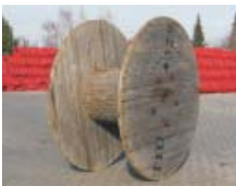
M6500 - Trommel M220

Abmessung: 200 x 65 x 2,6 cm EAN: 8595057687738