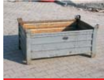
IP2 - Metallkiste

Abmessung: 180 x 120 cm EAN: 8595057688230