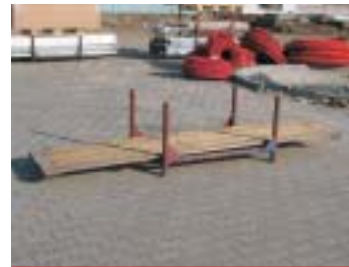
IP4 - Holzunterlage (+ IP1)

Abmessung: 250 x 67 x 2,6 cm EAN: 8595057687707