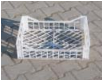
PR PAL - Transportbehälter

Abmessung: 160 x 240 cm EAN: 8595057687677