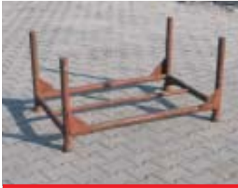
IP1 - Rohrpalette

Abmessung: 120 x 63 cm EAN: 8595057687660