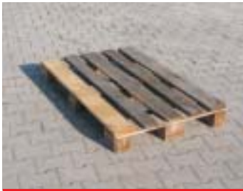
IP3-1 - Holzkiste

Abmessung: 120 x 80 x 60 cm EAN: 8595057687653