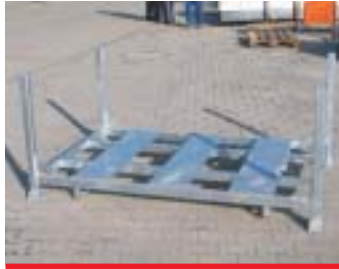
IP10 - Metallpalette

Abmessung: 120 x 63 cm EAN: 8595057687660