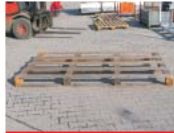
IP3-3 - Holzkiste

Abmessung: 120 x 100 cm EAN: 8595057687691